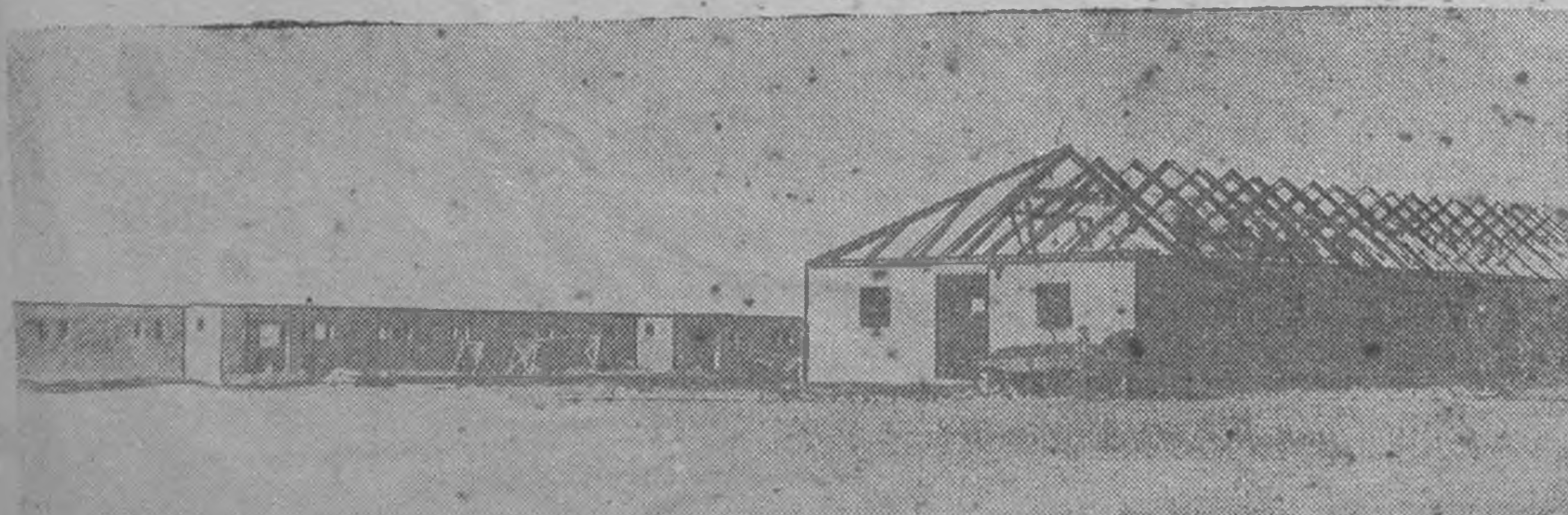
ЗУРГТ: Западн района „Пролетарская победа“ колхозд тосхлджэх, укрмүд болн тугьлмуд ордг хашас.