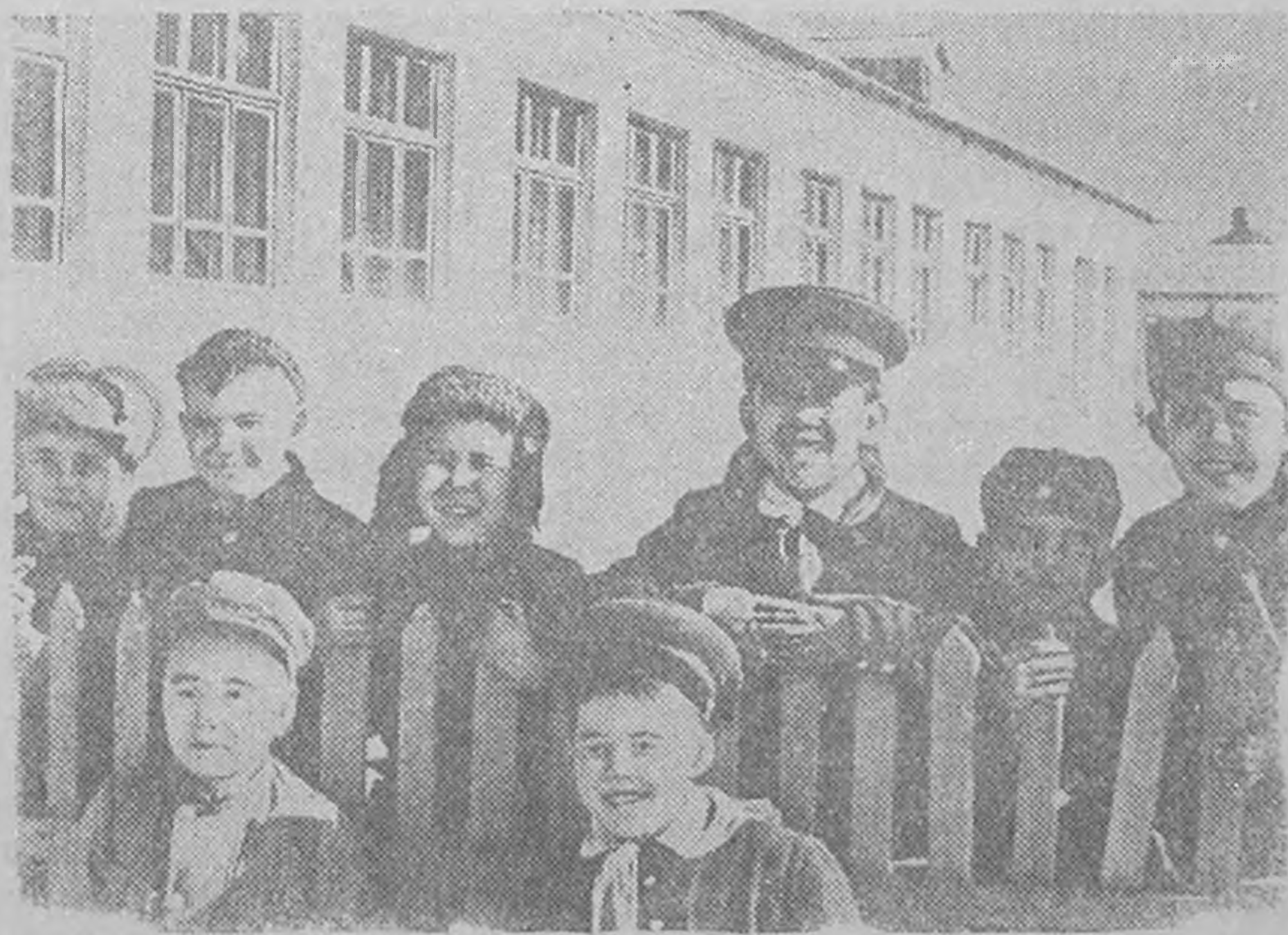
ЗУРГТ: Яшкуль поселка (Яшкульск района) тосхлгсн дундин школин и р. Тōрскн газрун пүүджд ирсн хальмгудин күүкд эн школ сурчәхәнә.