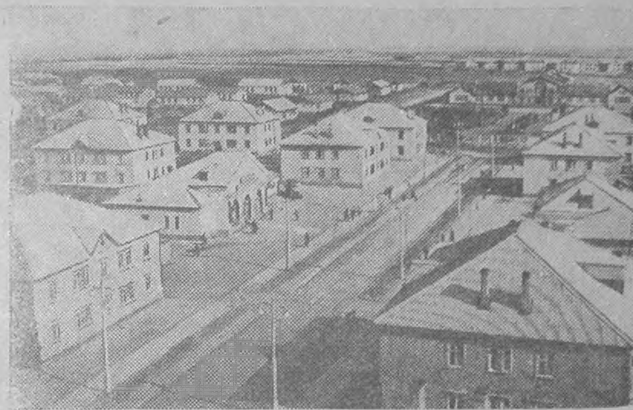
Кустанайск область. Ода тосхлгдях Соколовск-Сарбайск горно-обогатителн комбинат ула уга, Омн Урални металлургическ заводмудт кергтә төм рудан икнъкинъ өгдг болдж гархмн. Промышленн предприняг тосхлгъна хамдан бас горнякудин балгъсн—Рудный хураар өсджәнә. Амн бәәх 120 миньгъ гар бәәрн тосх-лдж одв. Хойр школ, больниц, өргн экранта кинотеатр, банно-прачечн комбинат, өлгмин завод, теплоэлектроцентраль, нань чигн тосхлтс кегдджәнә.