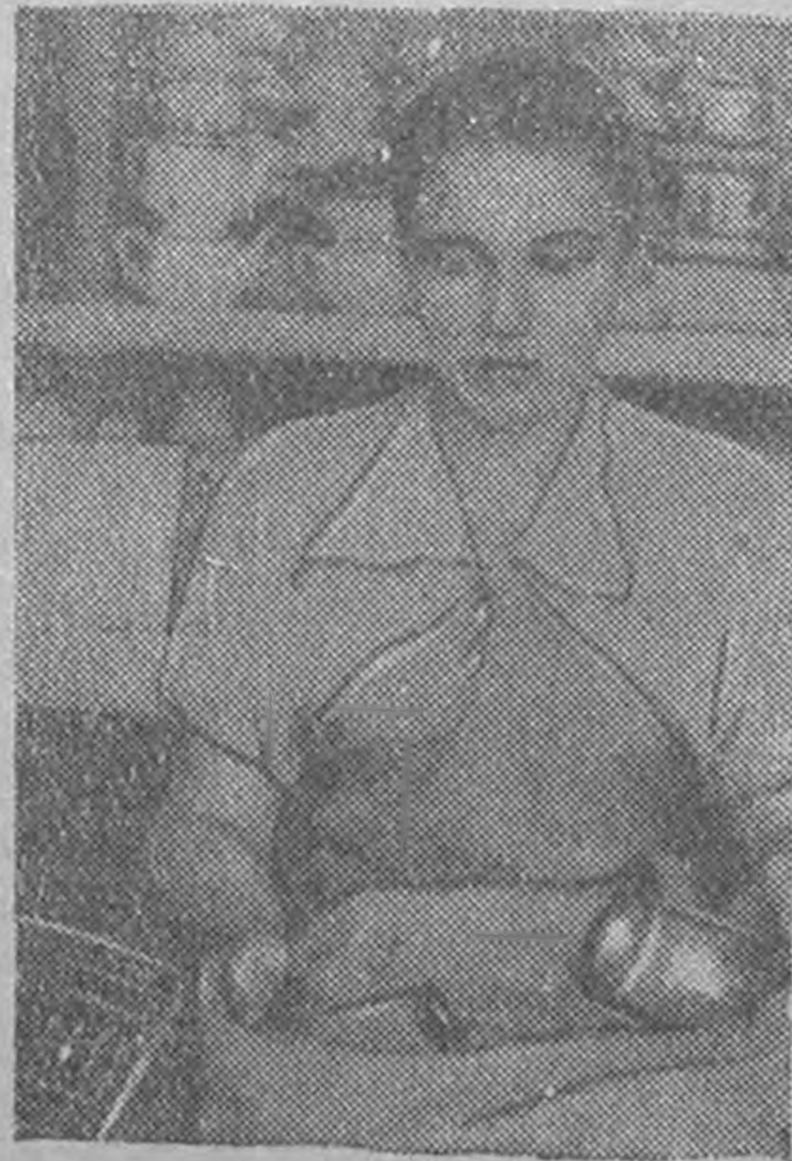
ЗУРГГ: Халымг ганџгъчнн погреб-союзин хозмагин хулдач, ончта сāанар кōдлџ А.И.Завьялова.