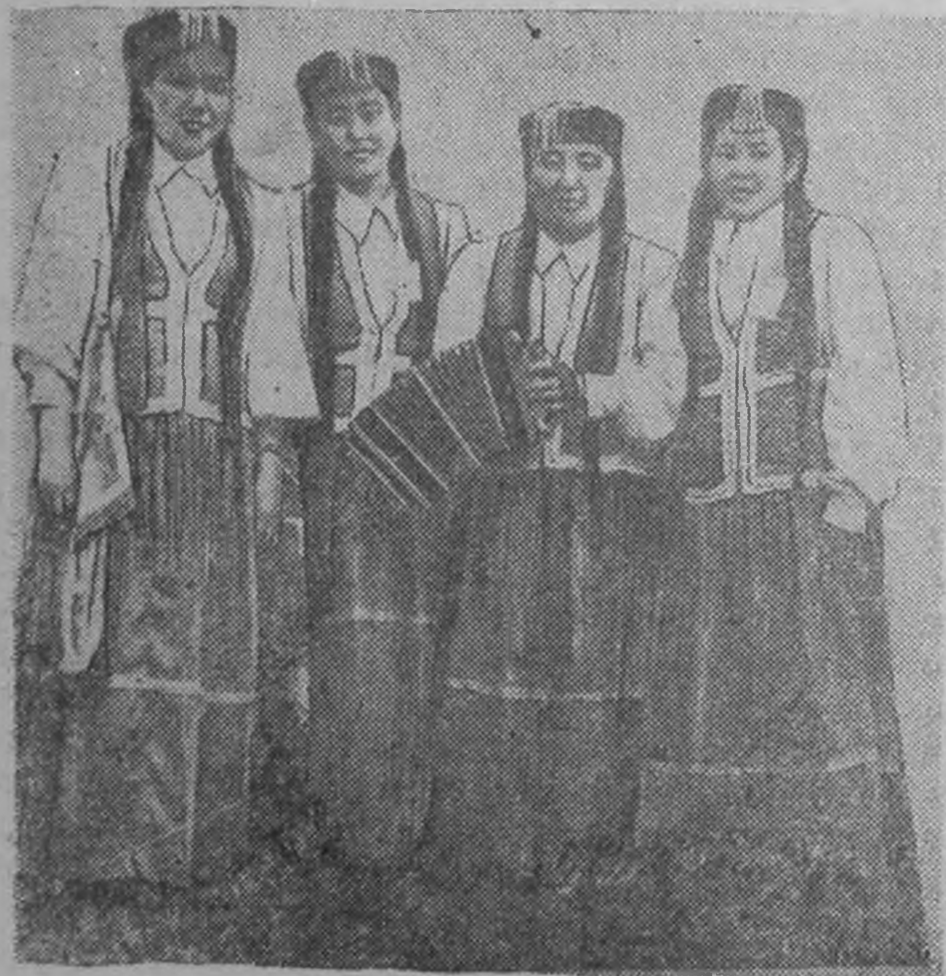
ЗУРГТ: Хальмг таньгьчин багьчудин негдгч фестивалд орлцсн При-ютненск района хальмг күүкд фестивалд иәр-наад гаргьдз үзүлхәр оң йовх цагн.