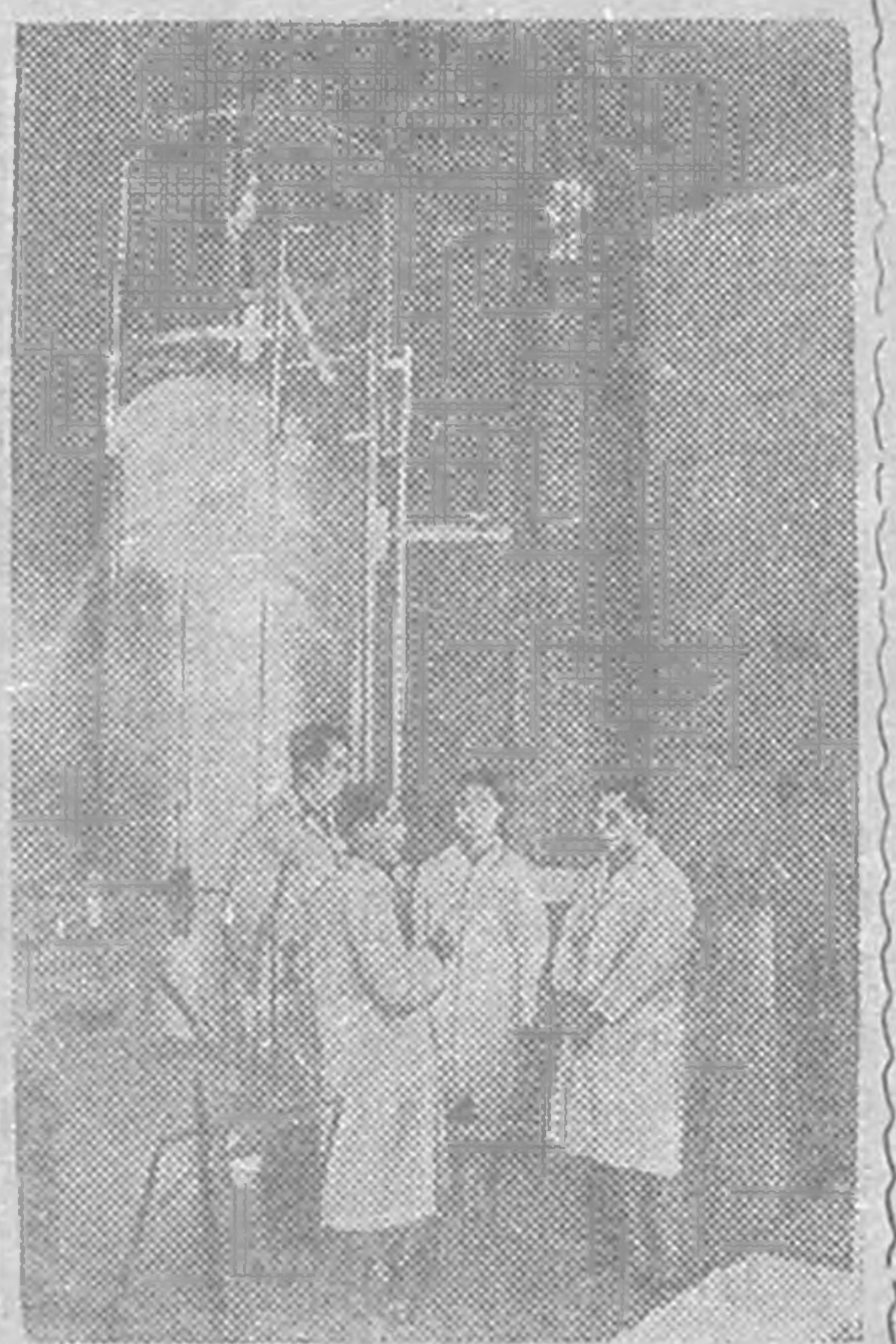
Китдин Олн-амтнэ Республикд эврэ ученс, инженермүд, техникс кедж тосхсн ик күчтэ электростатическ ускоритель.