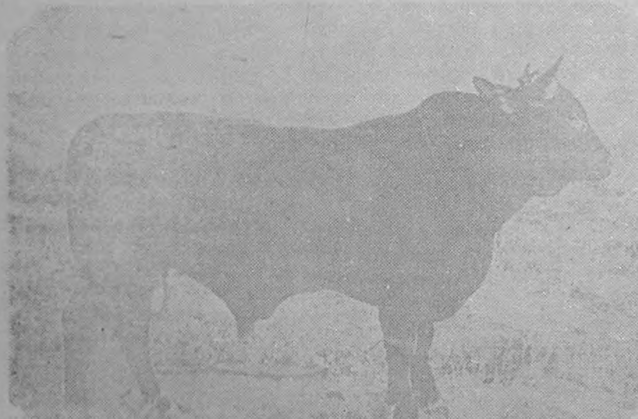
ЗУРГТ: Санта-Герттруда тохм бухта нинисн үкрэс гарсн „Сухотинский“ совхозин „Лотос“ гилг дөнн наста бух, эн ода 927 килограмм татна.

Чилин газет «Нотисиас де ультима ора» темдглсэр болхла, кэдлмш уга улсин то хурдар өсдгяхэс иштэ, күч-көлсчирин баядл муурчадгдг. Сүл 12 сарин эргид, Чилин хотл — Сант-Яго балгсэнд кэдлмш уга улсин то 267 процент өсдг.