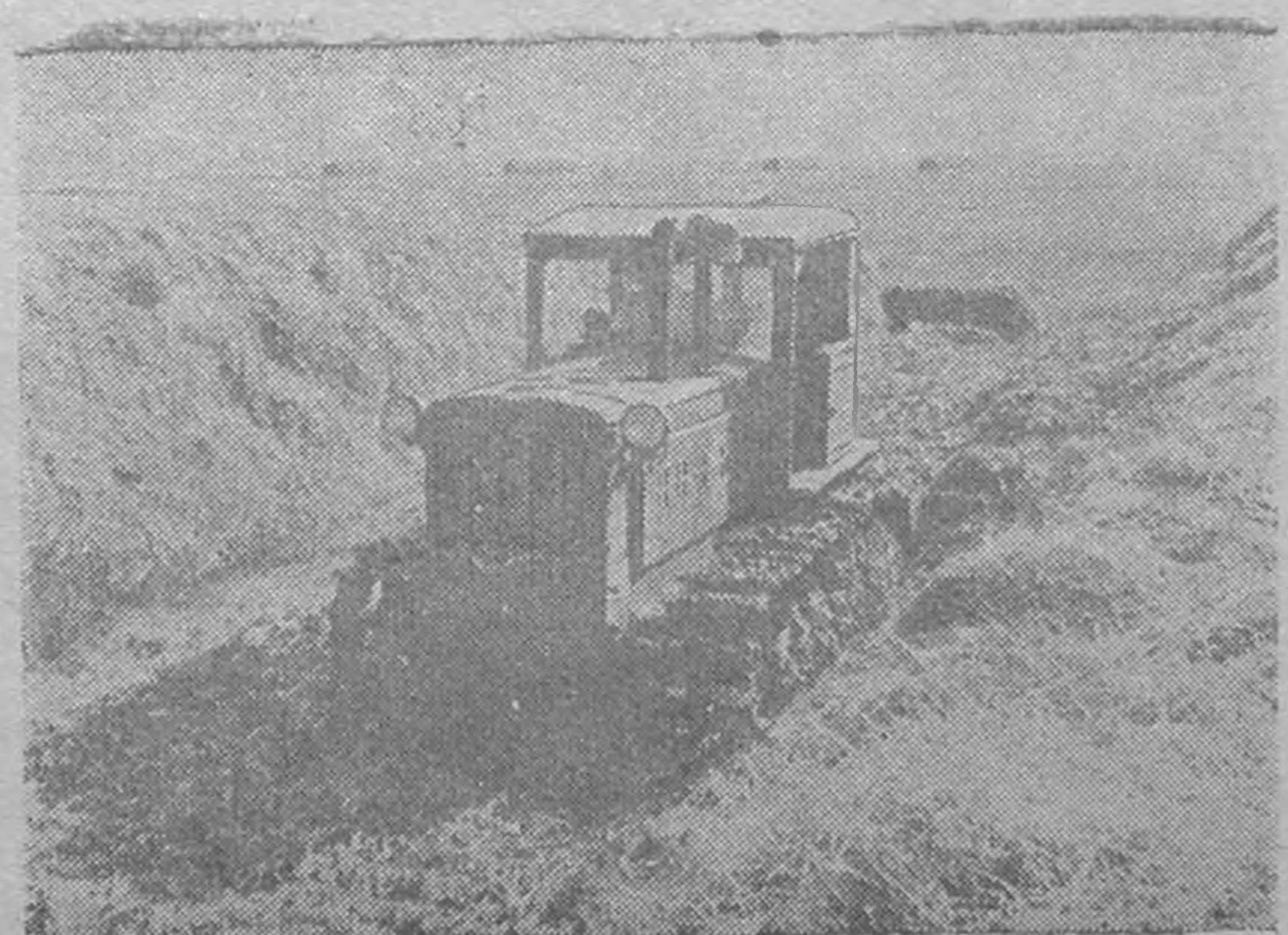
ЗУРГГ: Яшалтинск района "Победа" колхозд газр деер эрши-шишэгъар силос дарлджана.

Халымг АССР-н Деел Советин сунгъгъврн бдр куртл олна малд хойр джилдэн курх хот белддж авхин тблэ совхозин кудлмшчнр ноолддхачхана.