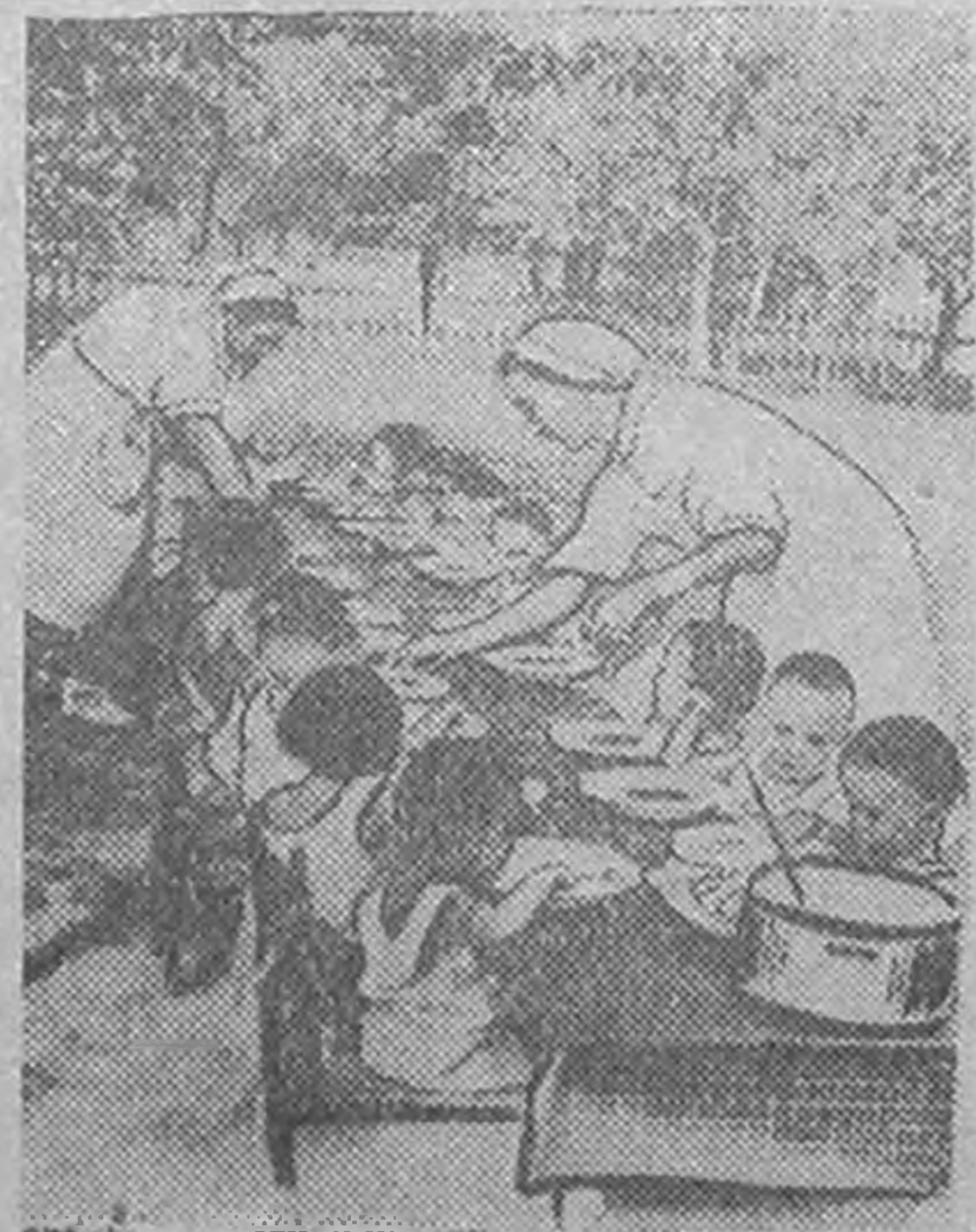
Баяцхнъгьтин детяслд куч-кблсчрин бички кууд-ковуд эк-эцкэн кблмшд йовсн арднь, эн яслин церглачнрин килмдгтй халачнрт баяцхана.

Энүнд бичкүд баядг гермүдн цевр-цевр. Дулан, тбвшүн барт бичгүд хотан газа, модна сүүдрт, цевр агьарт ууцхана.