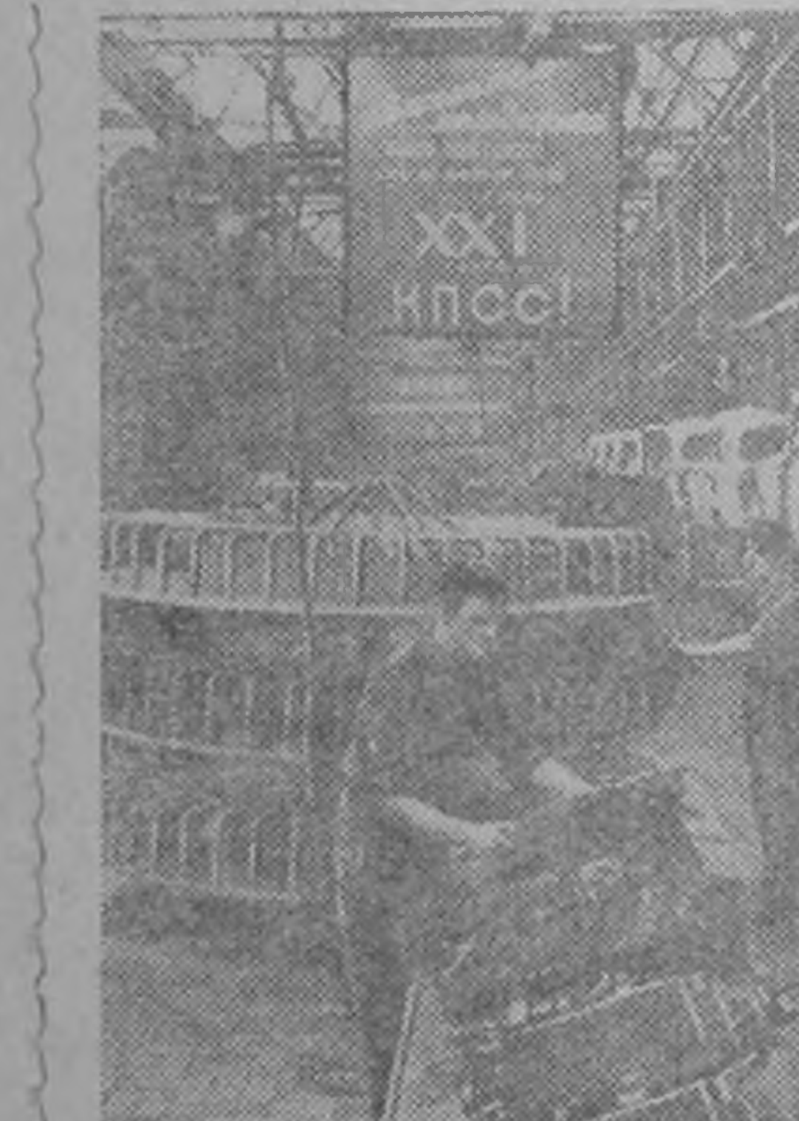
Москопск малолитражн ав-томобилин заводин кблмшчнр КПСС-н XXI-ч хургт белг гилж эн джил зурагъасн даву-лдж 2000 „Москвич“ гилг ав-томобиль гаргьх ик даалгьвр авб. Заводин коллектив даал-гьвран күүпэхэр шундджана.

Мана республикд ода клуб, 57 кинестационар, нотеатр, балгьсна 4 киноте-лиогек, умшгьна 58 гер-Республиканск дун-бичгь олна дурнэ болж багтв. Р-драмтеатр бурд. Элстд ку-бурлэгдв, туун бичкүд-джана. Республиканск хой-дегтр гаргьач баянэ. Ку-амтн хальмг өрс хойр ке-дэн болн дегтрүдэн умш-мг бичачнрин республи