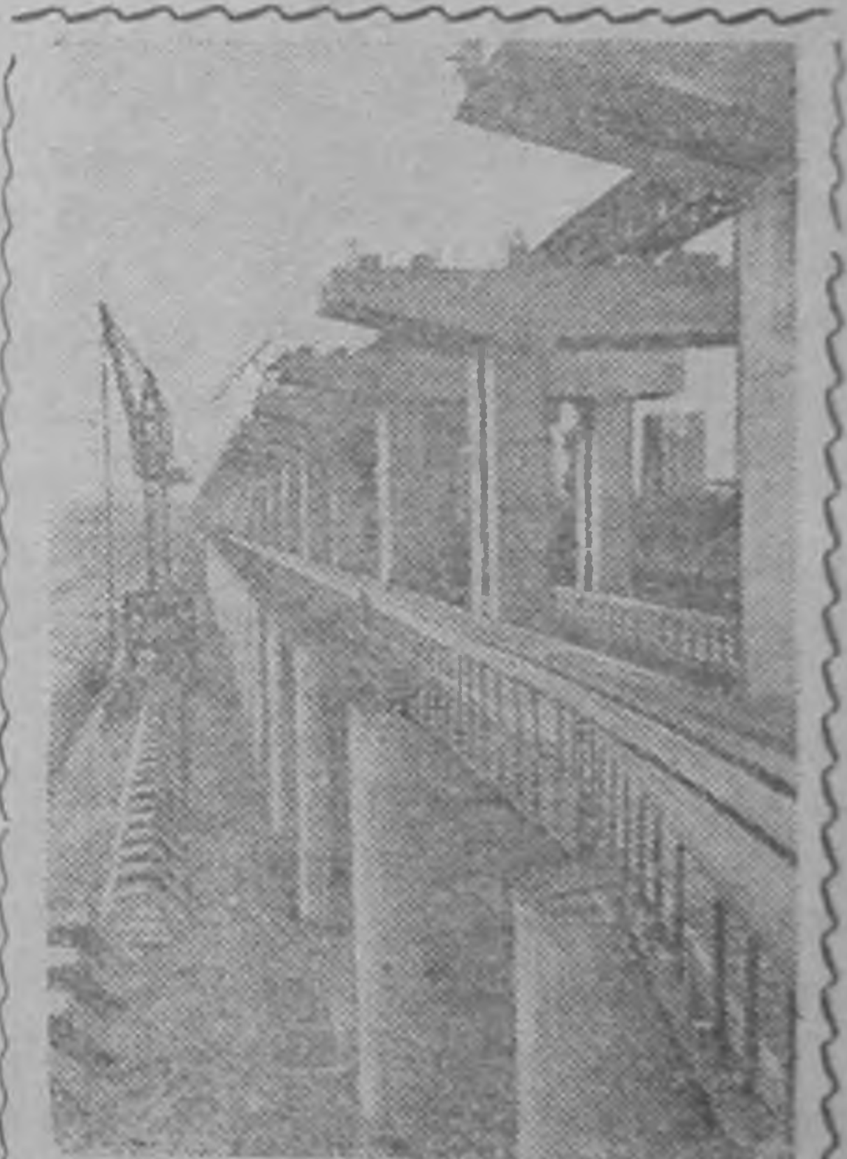
Сталинградск гидроэлектростанц тосхлгнэ ик чинотэ цань ирв. Гидротосхачир октябрь сард Илжнлг босггад, джилнн чилгчэр түүрн хойр гидроагрегатиг эклдж кблгх даалгвэр авб. Цуг участк-сар Алдр Октябрин 41-ч ббниг бо-лн КПСС-н XXI хургиг уктгч со-цббрэдэн бргэр делгрдэжнэ. ЗУРГТ: котлованиг дуургхнн бин усн ордг боодгил бнэг.