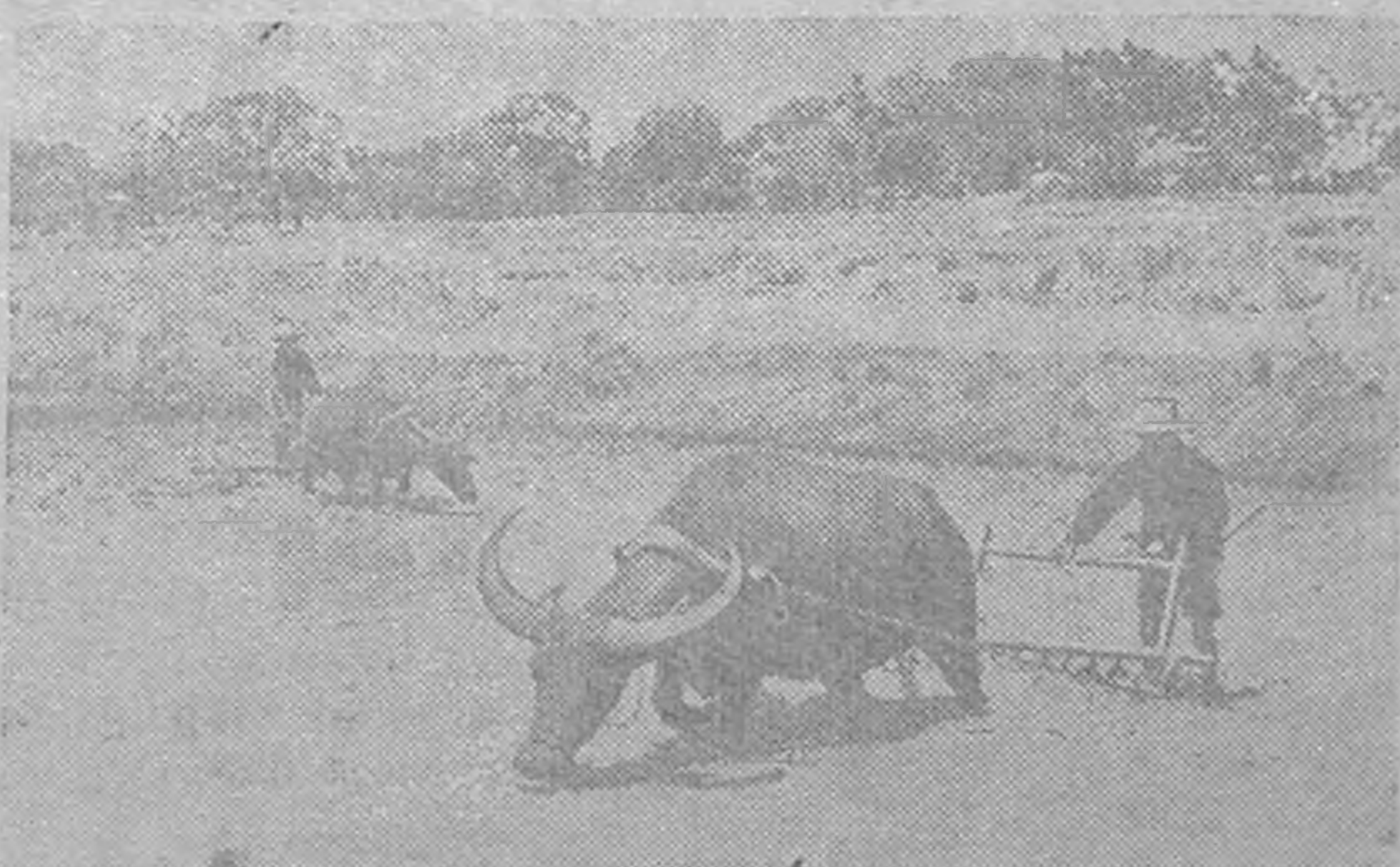
ФИЛИППИ Н. Крестян буйволар тутргъ тәрх газр хагълждана.