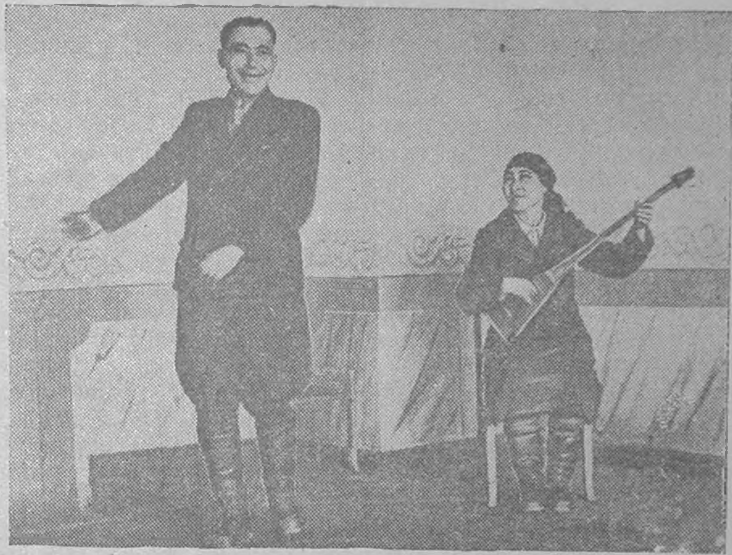
ЗУРГТ: Черноземельск района Артезиан поселкин Босаев Гучн дуулджана. Домбрчнь Шеркешева Бося.

Эн фестивалъ келгннд Элст балгъсна школин сургъульчнр ик дөнъ-нөкд болх зöвтä. Олн зүсн цецге болн флажокс эдн белдхмн, нарт делкä дän уга бääхиг дурдлг — көгдлджргъс авч ирхмн. Теднä, тенгър öдд ирсдж, седклд күүл-дживр ургъалгъна тачал кесн — көгдлджргъс нислдän болхмн.