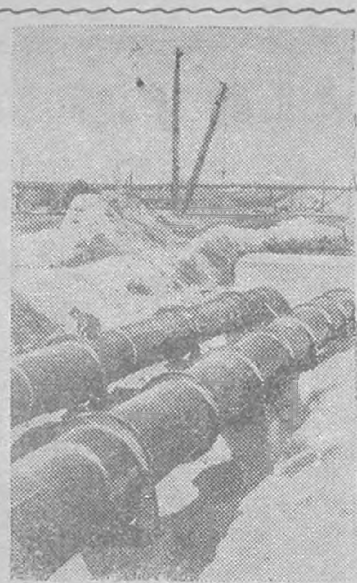
УЗБЕКСКА ССР. Харсу теегт ирригационн көдлмш икэр делгрэж кегдэж йовна. Баятск районд тосхгдэжэсн насосн станци Харсу теегин Омн каналас, эмнэ газринг усар теткэж олзлж аргъ өгхмн. ЗУРПГ: тосхгдэжэсн Баятск насосн станцин трубопроводс.

ЖУРАВСКИЙ К. Черноземельск района олна заргъч.