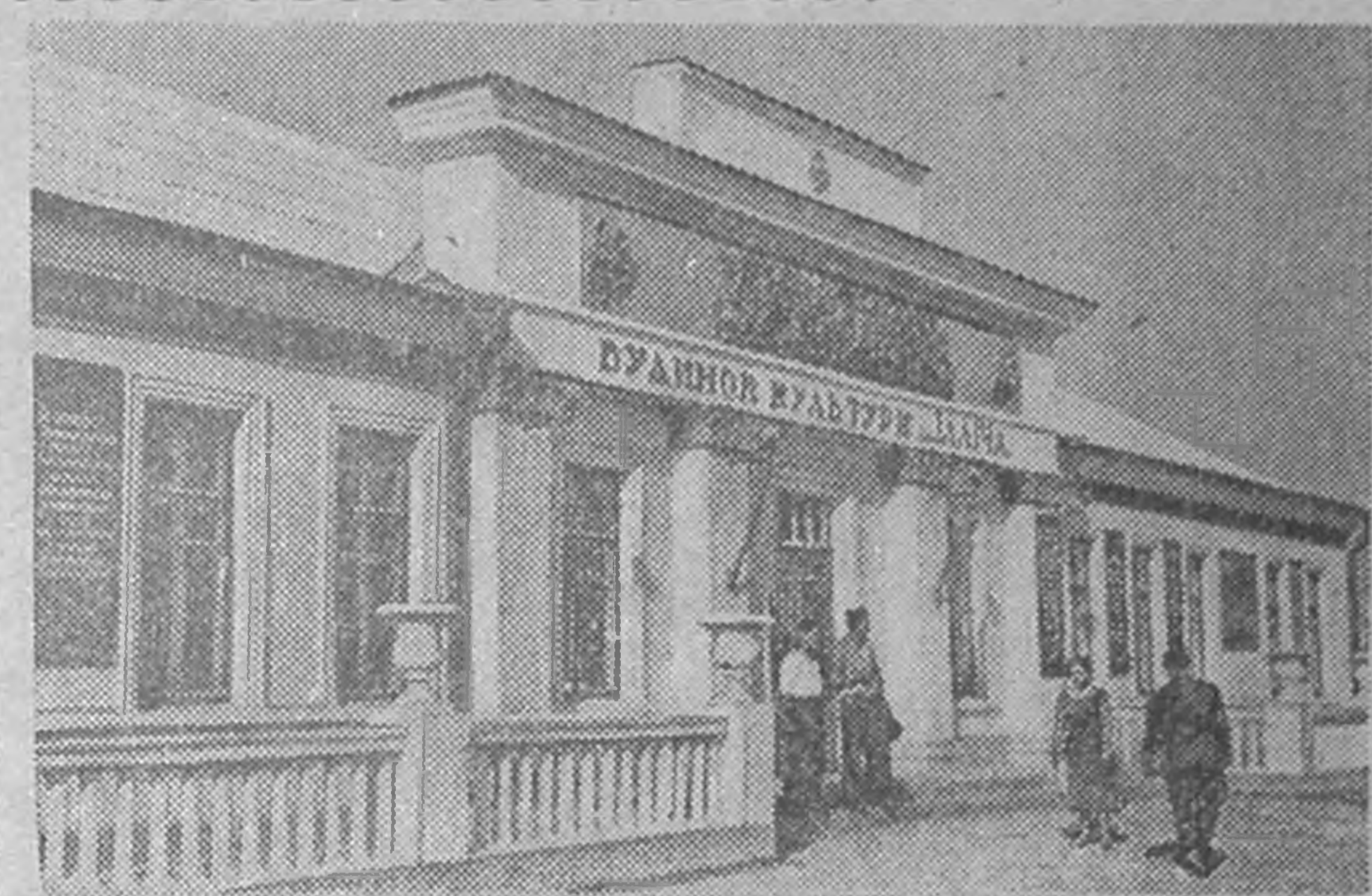
ХЕРСОНСК ОБЛАСТЬ. Колхозмудин клубс болн культурин Гермуд бәрлгъәр Скадовск район областьд негдгч орм эзлв. Ода дөчн селәнд культурин Гермуд бәәнә. Колхозмудин теегин бригадет болн станмудт клубс бәрдгдхәнә. Селәнә эдл-ахун „Советская Украина“ гидг артельд тосхгдсн Ильичин пертә культурин Герг 450 куунә ормта зал, худо-ествени самодейательность көдлх өрә, умшлгнә залта библиотек бәәнә. ЗУРГТ: Селәнә эдл-ахун „Советская Украина“ гидг артелин культурин, Ильичин пертә Гер.