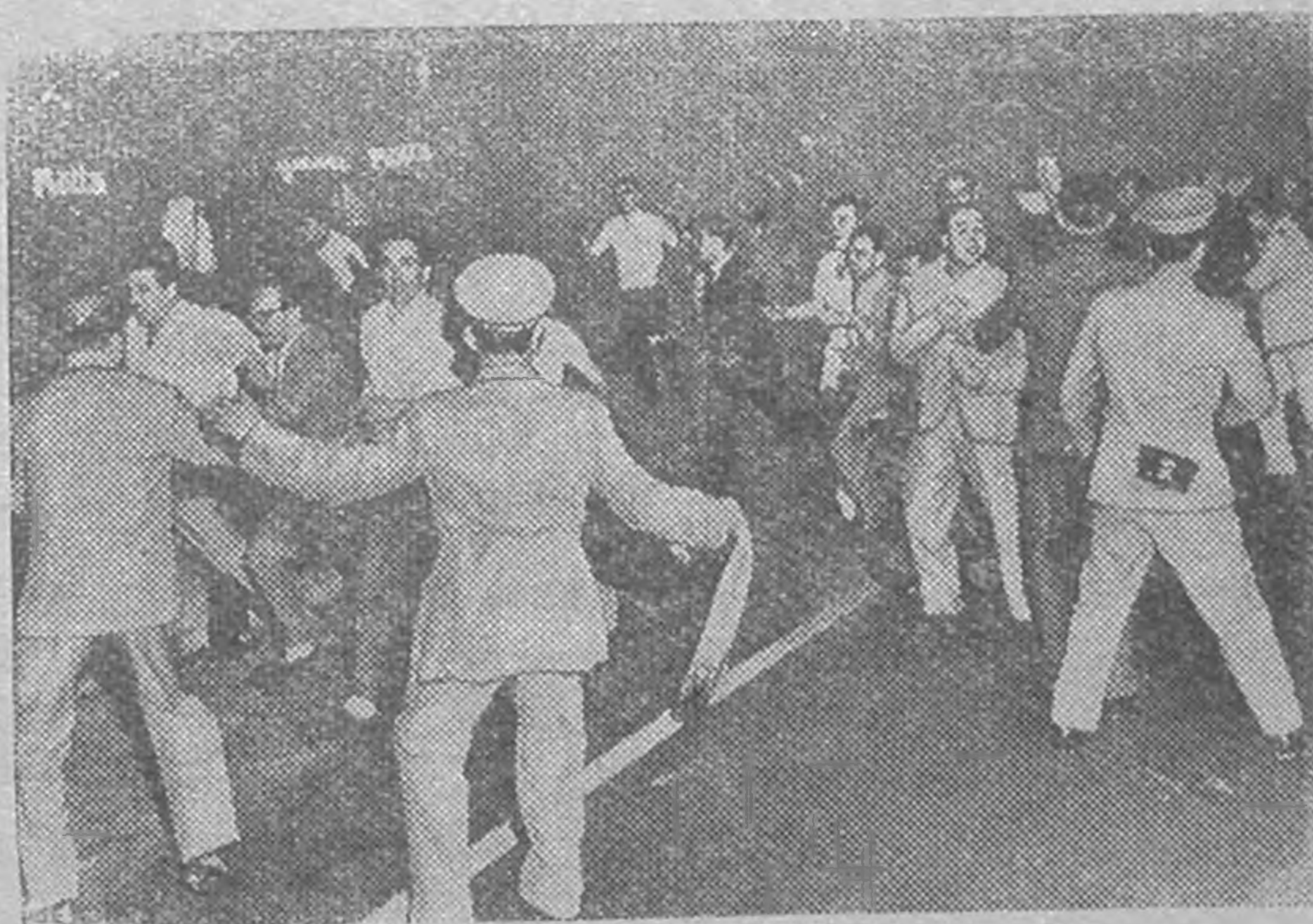
Ближн Востокд империалистическ зертэ-зевтэ дэврлгъ келгъин Италин күч-көлсчнр икар бурушаджана: ЗУРГТ: Римд, США-н посольствин герин бмн кегч демонстрац орлчачнриг полиц таралж кбдджанэ. Демонстрац орлчачнр америк-н цергүдиг Ливанас түдвр угагъар гаргъдж авхиг нецхав.

Школд орх эрлгъс бдр болгън ним хайгар авгдхмн: Элст балгъсн, Революцион уульниц 8-ч гер, школин дирекц.