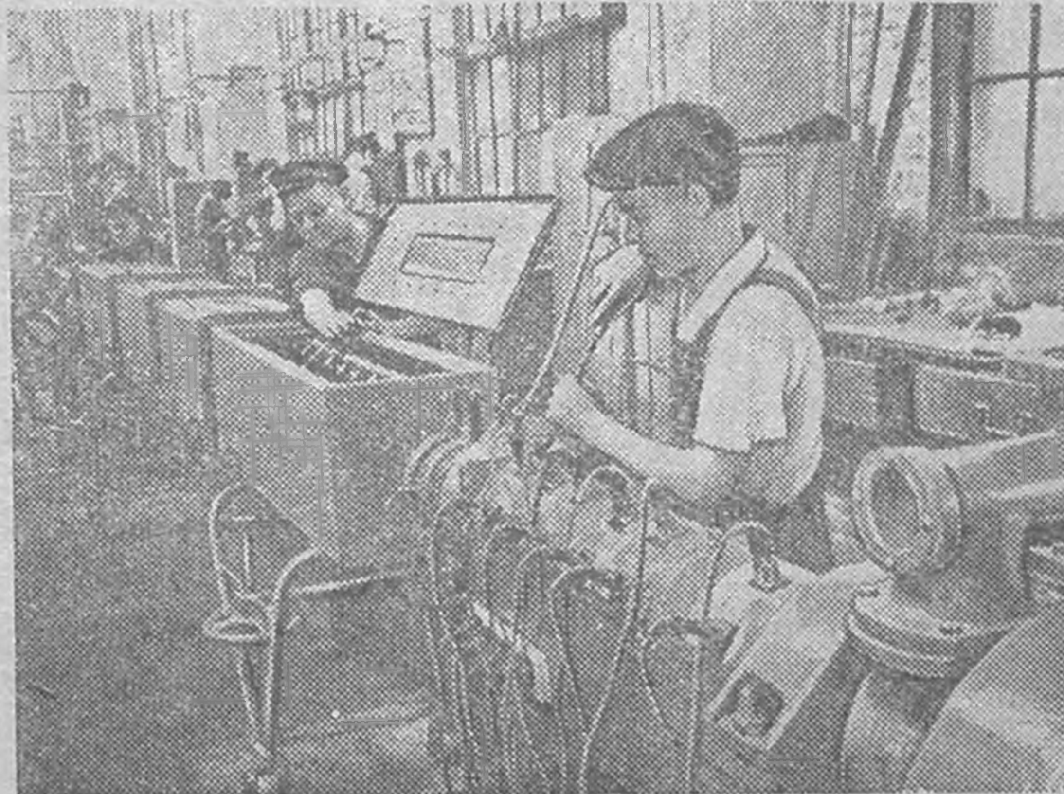
Киевск "Большевик" гилг заводт, полиэтиленовой труб кедг автоматическ линий шүүдж хәләгддәнә. Тер трубас, химическ промышленностьд, зеврдг болдар болн нань чигн цутхмар кедгсн трубасиг сольхмн. Пластмассар кесн труба төмрәр кесн трубасар болхла бат болчкад, кесг холван кимд болдгн дамшлтас медгь. ЗУРГТ: Автоматическ линий диглгддәнә.