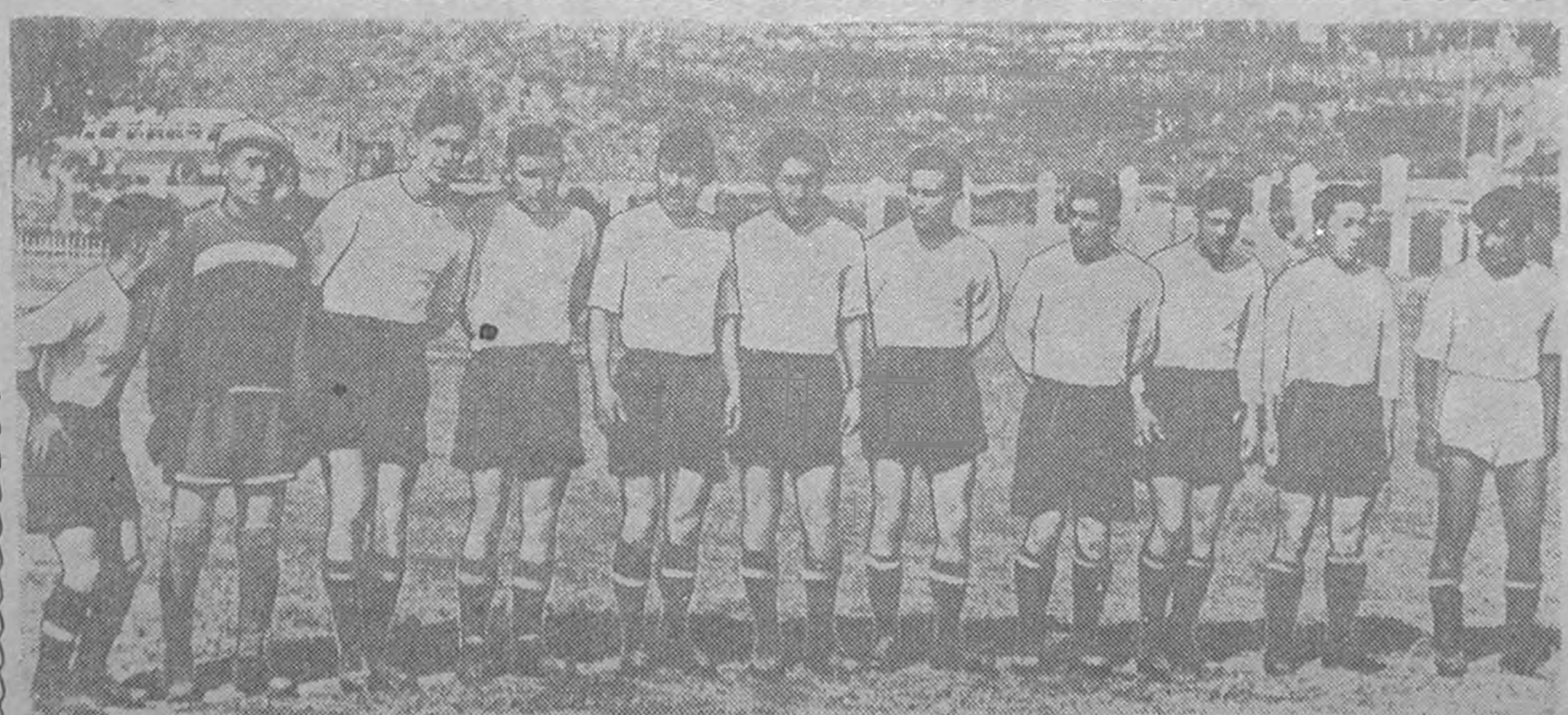
Хальмг АССР-н 1-ч спартакнадт днләд, 1958 джилд футболар Хальмг республикин чемпион гих нер зүүсн Элст балгъна команд.

Эн дун, республиканск негдгч бил-эрдмнн хәләлгънд Юстин район-нас орлсн, БОТХАРАН Эр-днн, домбрт келдз дуулснас бичдз авгдв.