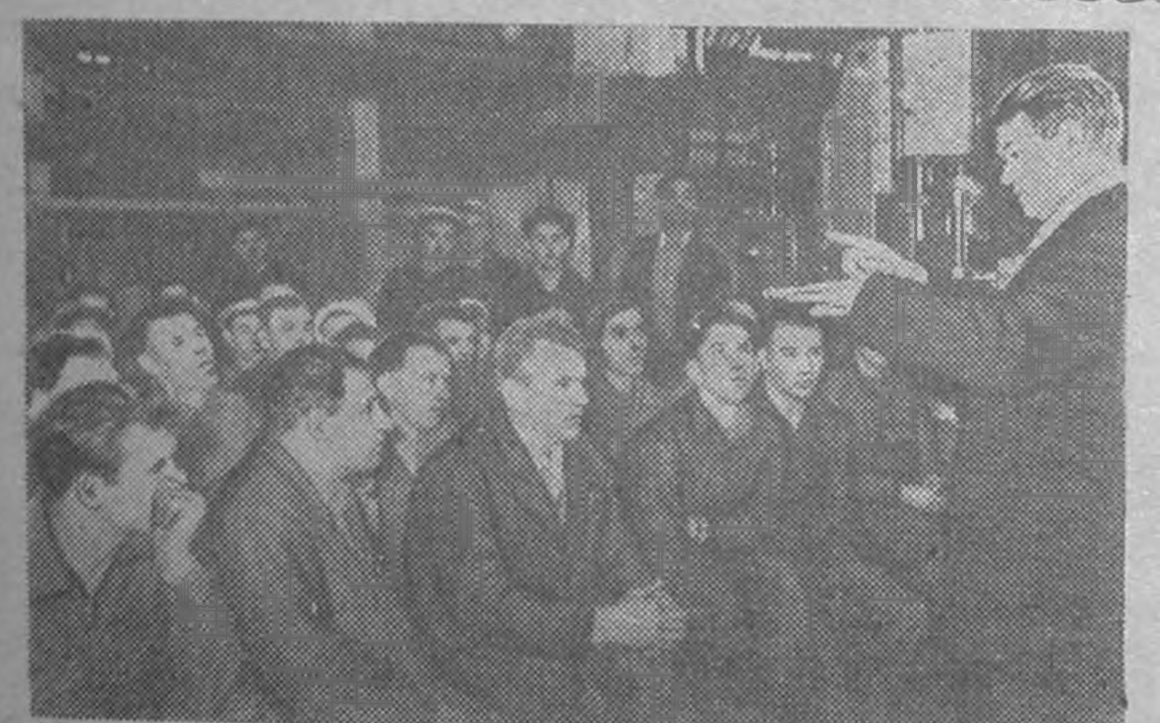
Московск, Лихачевин нернä автотаводт номтнр дару-дарунь ирдж доклад, лекц кенй. Одахн эн заводур Штерн-бергин нертй Государственн астрономическ институтин болн Московск Государственн институтин научн олн көдлчнр ирв. Удин завсрлань астрономс, инструмен-тальн, ясврн-техническ, рессорн-көгин, автобусн, нань чигн цехст кесг лекц умшв. ЗУРГТ: 3-ч цех. Физико-математическ науксин канди-дат Г. П. Пильник «Астроном олн-ймтнй эдл-ахуд» гндг лекц умшджана.