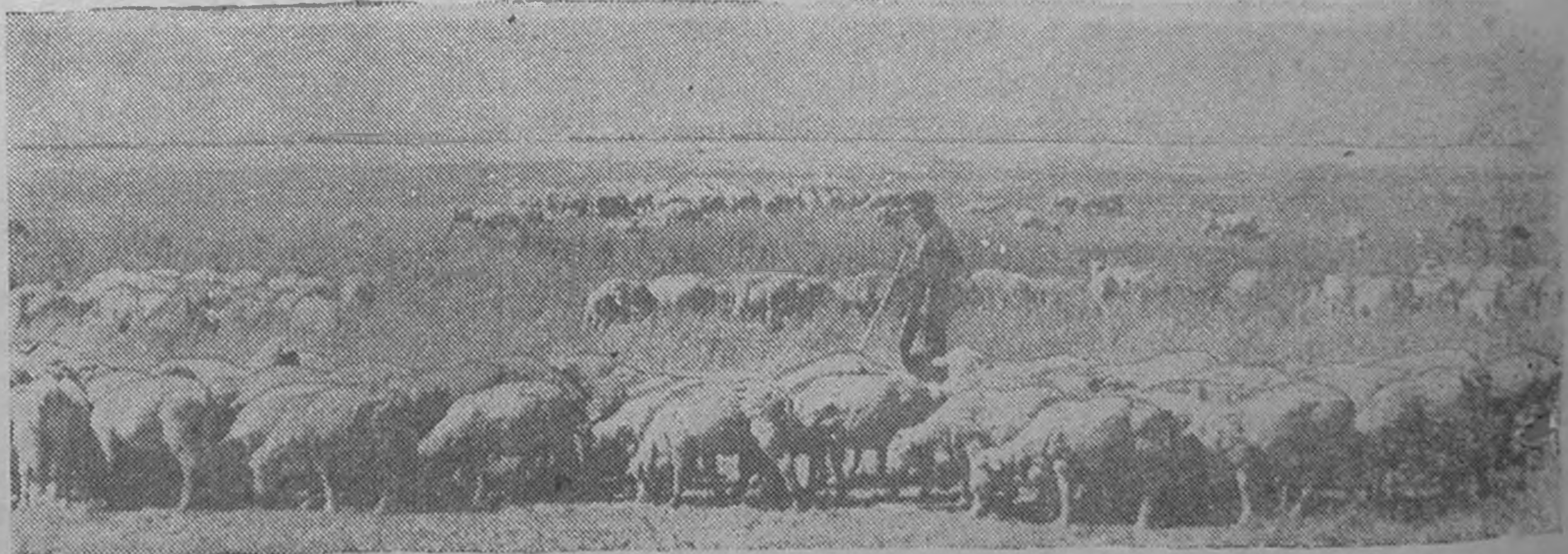
ЗУРГТ: Сарпинск района Чапаевин нергэ совхозин, зурагьар хбн болгьнас 3-д килограмм ноос киргьхнн ормд 3,7 килограмм ноос киргьдж авсн ах хббч Кеесев Эрдин Картыкович.