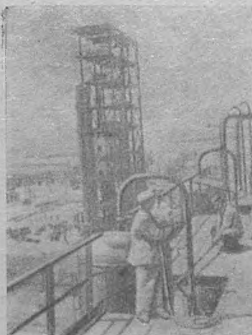
Азербайджанск ССР. Нефтин шагәс каучук гаргәд Сумчантск синтетическ каучукни заводт газ хувадт станок тәвдлжәх цаг.