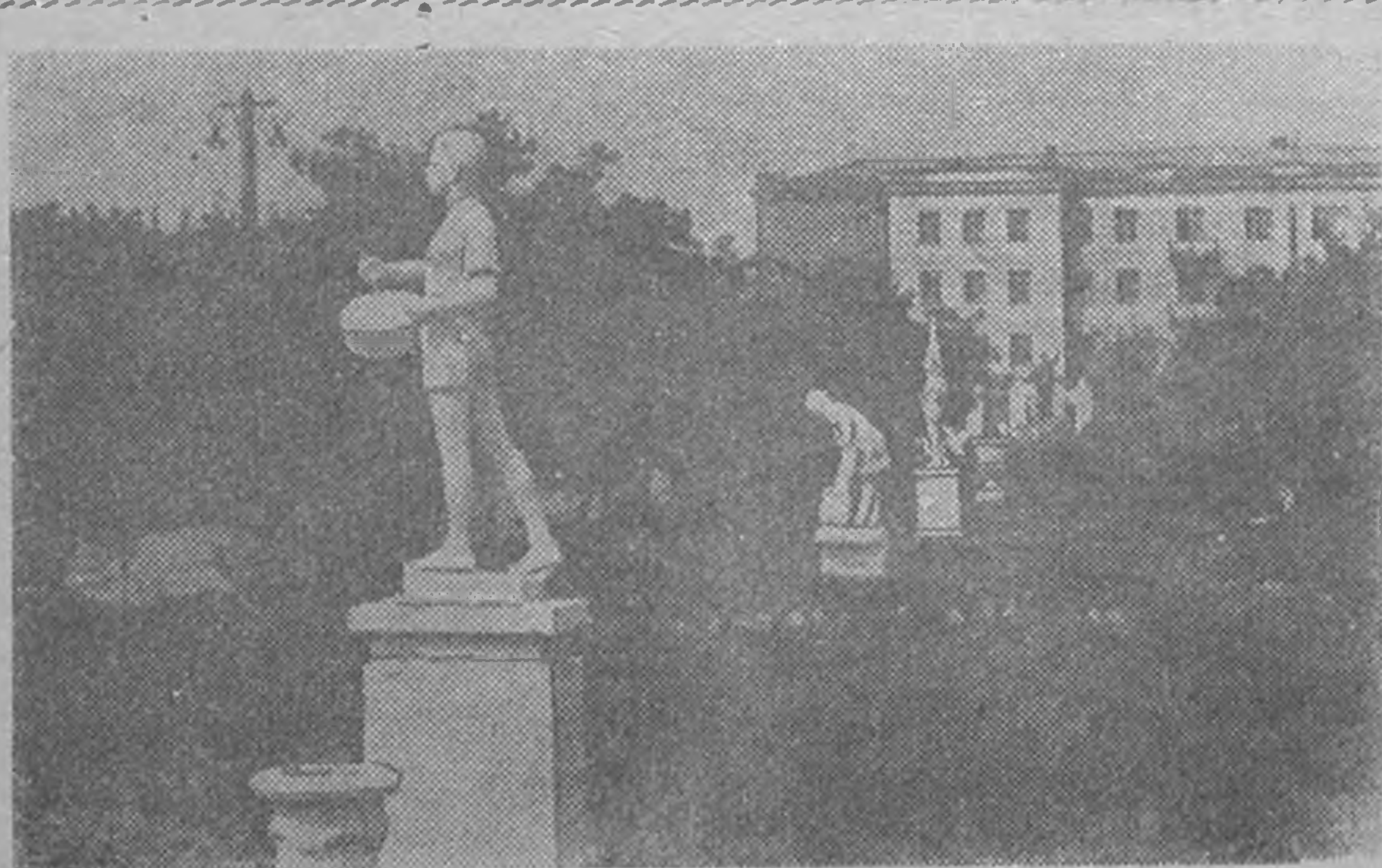
З У Р Г Т: Элстин паркин дунднь.

4 минггн 500 каракульск хурсх зура деер государствд өгхэр шунлтта кевэр ноолдлажачхана.