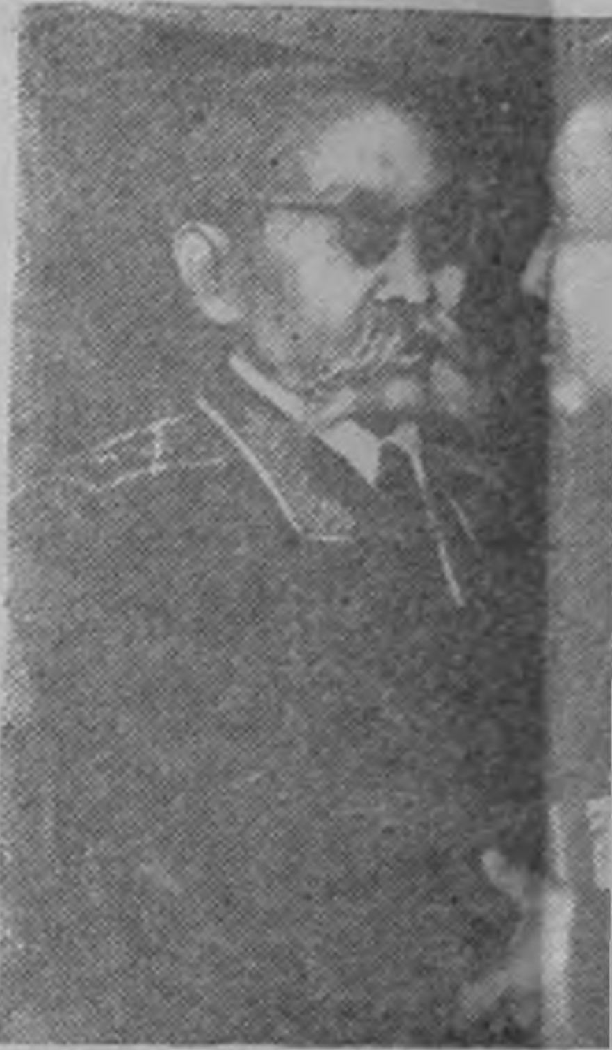
ЗУРГТ: Советск Союзд баах генерал-полковник (довиков, хамдан Улан Цел Кулешовла күүнджәнә. Р. Аст

Хальмг таньгьчиг Хальмг Автономн Советск Социалистическ Республикд хуврәлгьнә мана социалистическ Төрснә