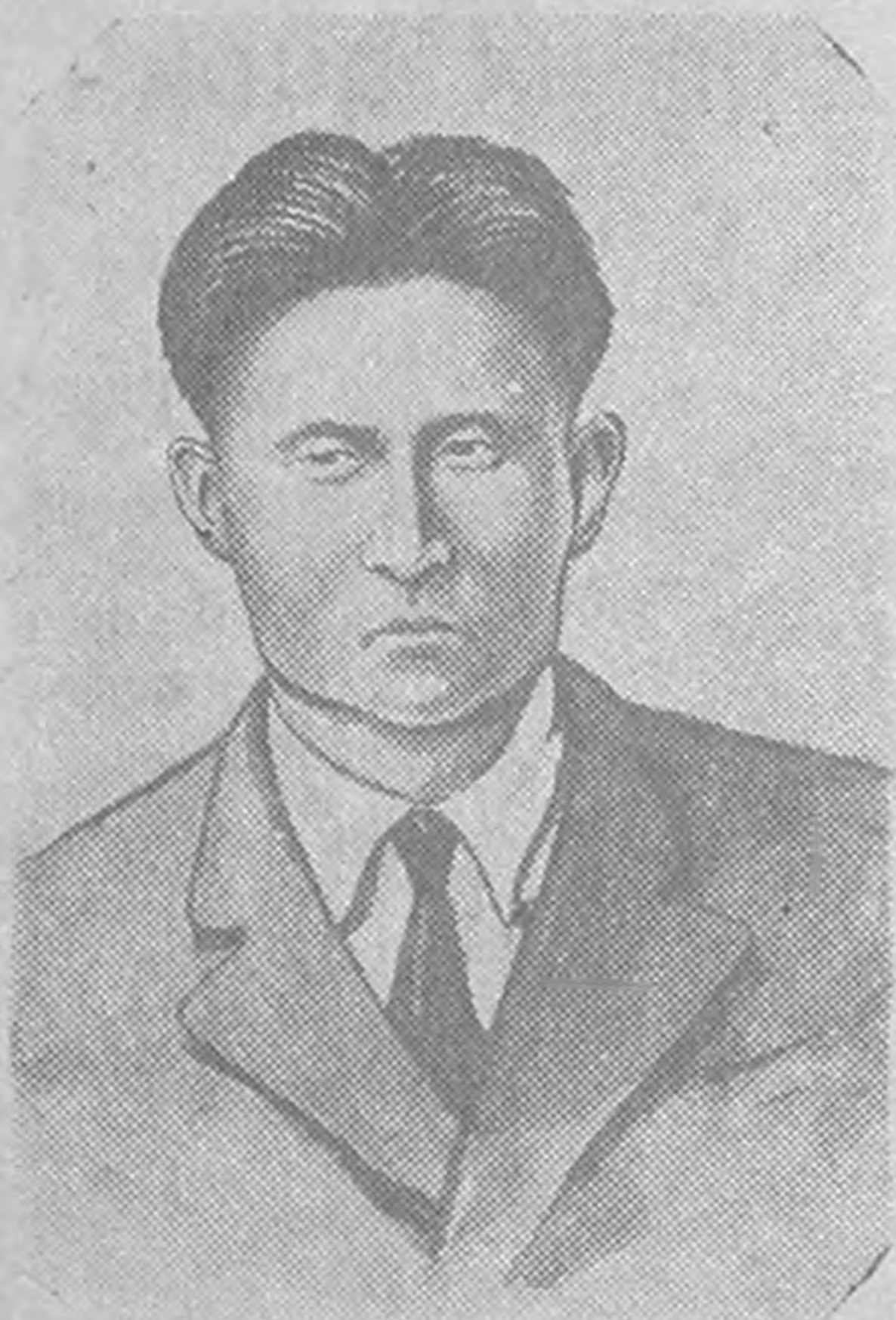
Эн кдлмштэн 1936 джил куртл кдллэ. Ленинградт журналистин институтт Цери одла. Болв, эн сурггулян төгсгхдн

Рабфак төгсөснәннь хөдн Цери Хар газрт района газетин редактор болдж кдлджав.