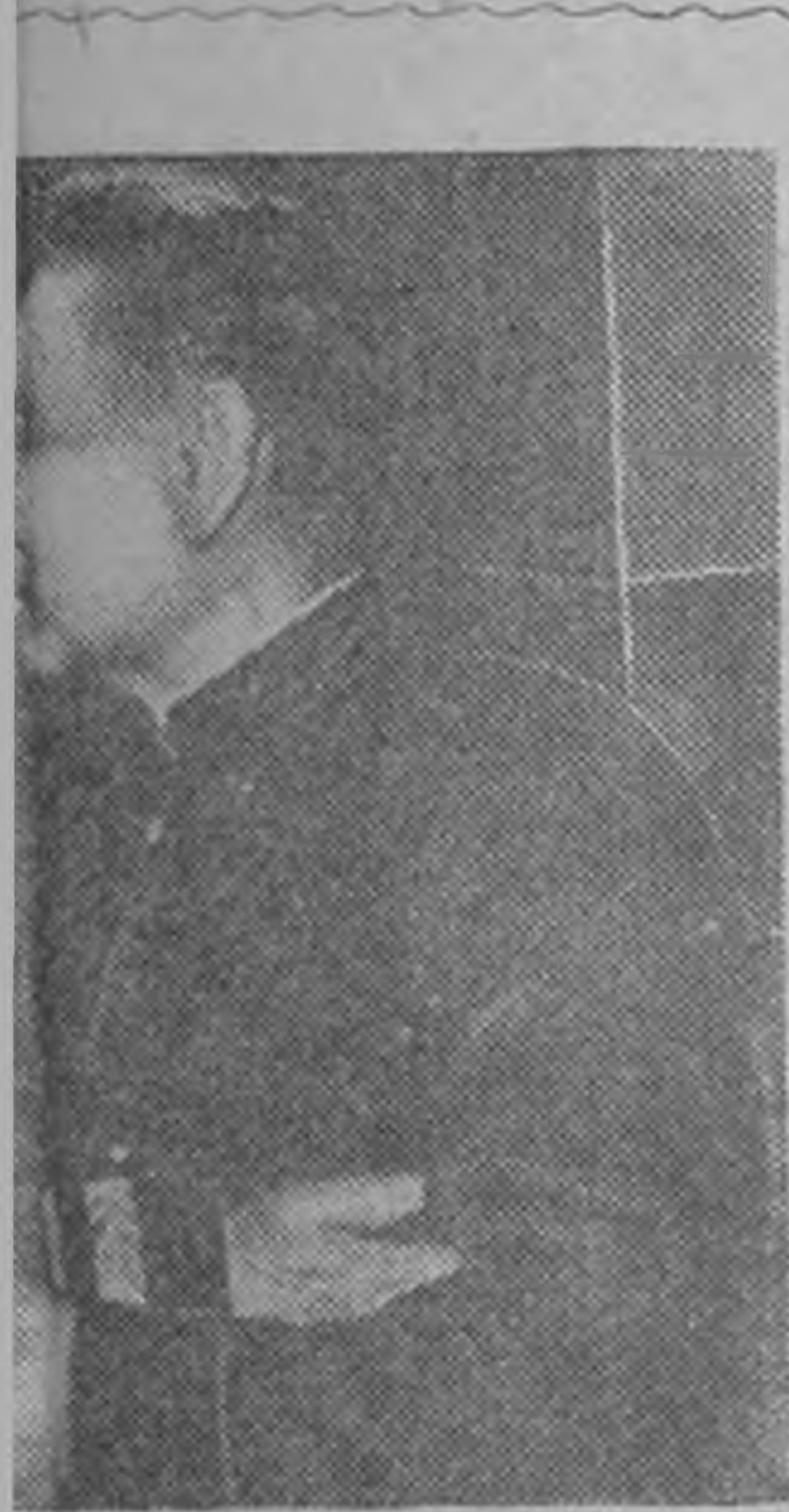
Юзин Герой, отставка ник Ока Иванович Горо Цергт йовсн майор Э. А. на. Астахов н цо кси зург.

Бар сунъгъврн округсин, күч-көлсчнрин болн олна организацсин элчнрин хург