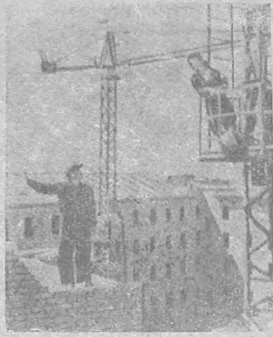
Оренбург. Балгъсна амтс эн джил 100 мингън квадратн метр зээтэ пэтрмүд авхми. Энд кэдлмш өргэр делгрдж кегдлжэнэ. Балгъсна захар шин уулынц гарчана. Нижегородской уулынц айга күтц гермүдтэ квартал тосхгдв. Нань чиги кесг шин кварталмүд тосхгддана. ЗУРГТ: Оренбургск ТЭЦ-н кэдлчнрт бэргдлжэх шин гер.

Тангъчин потребсоюз болн горторг хойрт хойрдгч лотерейн билетэр шуугдх олгэдин гээхүл балгъснд болн республикин райодин центр-сар бүрдэтхэ гидж заквдв.