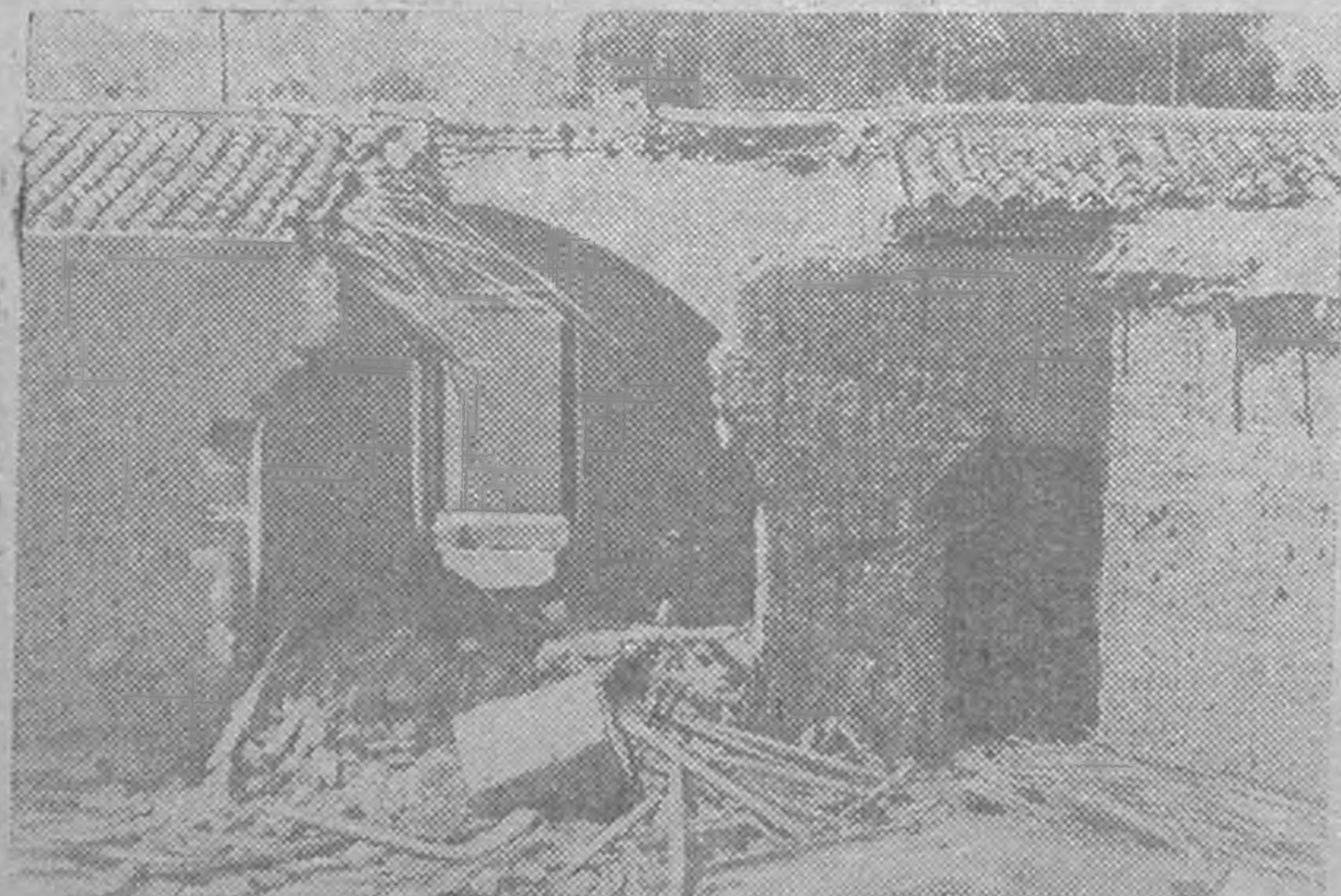
ЗУРГТ: Кипр ард деер английск цергүд бaaрн амтс бултулсн зер-зев хaaнәвди гигьад, Лиса гидг селәнә англин салдсмудин хамхлхкн крестьяна гер.

Ода Нью-Йоркд болджах ООН-а Генеральн Ассамблейин XIII-ч сессийд Советск делегацин толгьач А. А. Громыко эврәнн келсн үгдән, США Англч хойрин эн аалиг илджк келәд, Ливанас болн Иорданәс американ-английск цергүдиг гаргьхн туск төриг сессийд күүндгдх төрт орлицулхиг некв. США-н болн Англин цергүд Арабск Востокд болн бас тер мет талдан чигн райодт бaaлгьн — төвкнүн бaaлгьнә төрт зеткртә ашта болхиг тоолджах, төвкнүнд дурта кели амтс цугьар тер неквриг таасдж дөннджәнә. Н. ЧИГИРЬ.