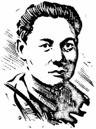
—Энунтд уснас чигн ху урй гарггдх — гидж пугтар келв.

килг шалвр хойрта, бргн ул бустд, эвткн цогцта, кезадчн бийсн хббггдг уга эвранны иньг болн багшн — Островский Николайин „Болд ягълж хатагдсб“ гидг дегтр гарнн, Бамб цецг партизан-мудин дуринь болн селкл-уха-гынн ээлсми.