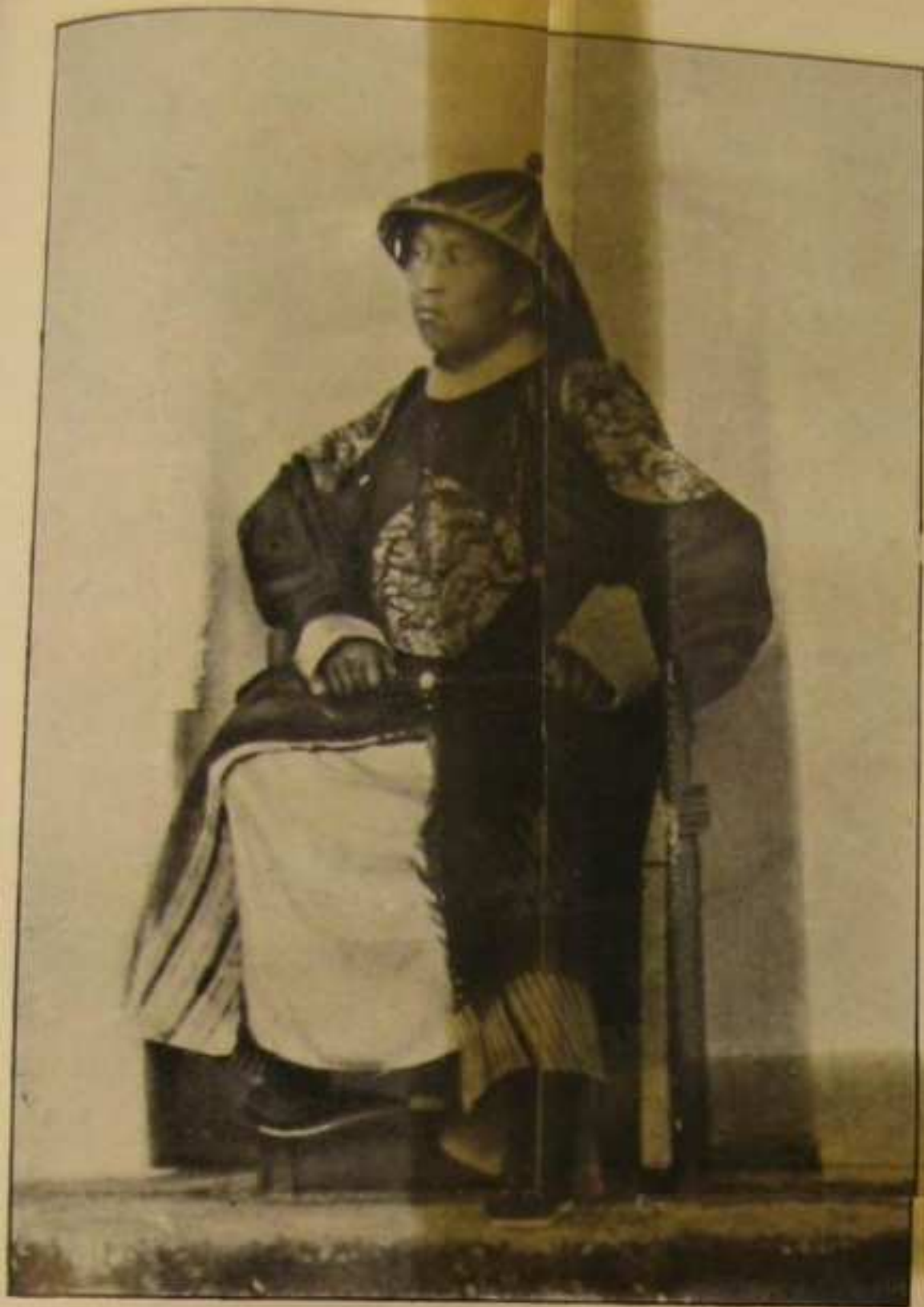
Карашарский Торгоутский Хан Бийи-Мюккэ.