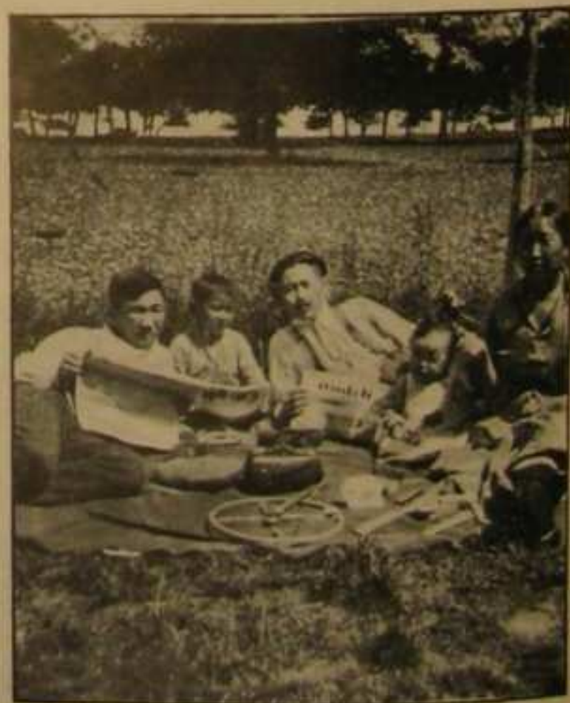
Из жизни эмигрантов-калмыков во Франци.