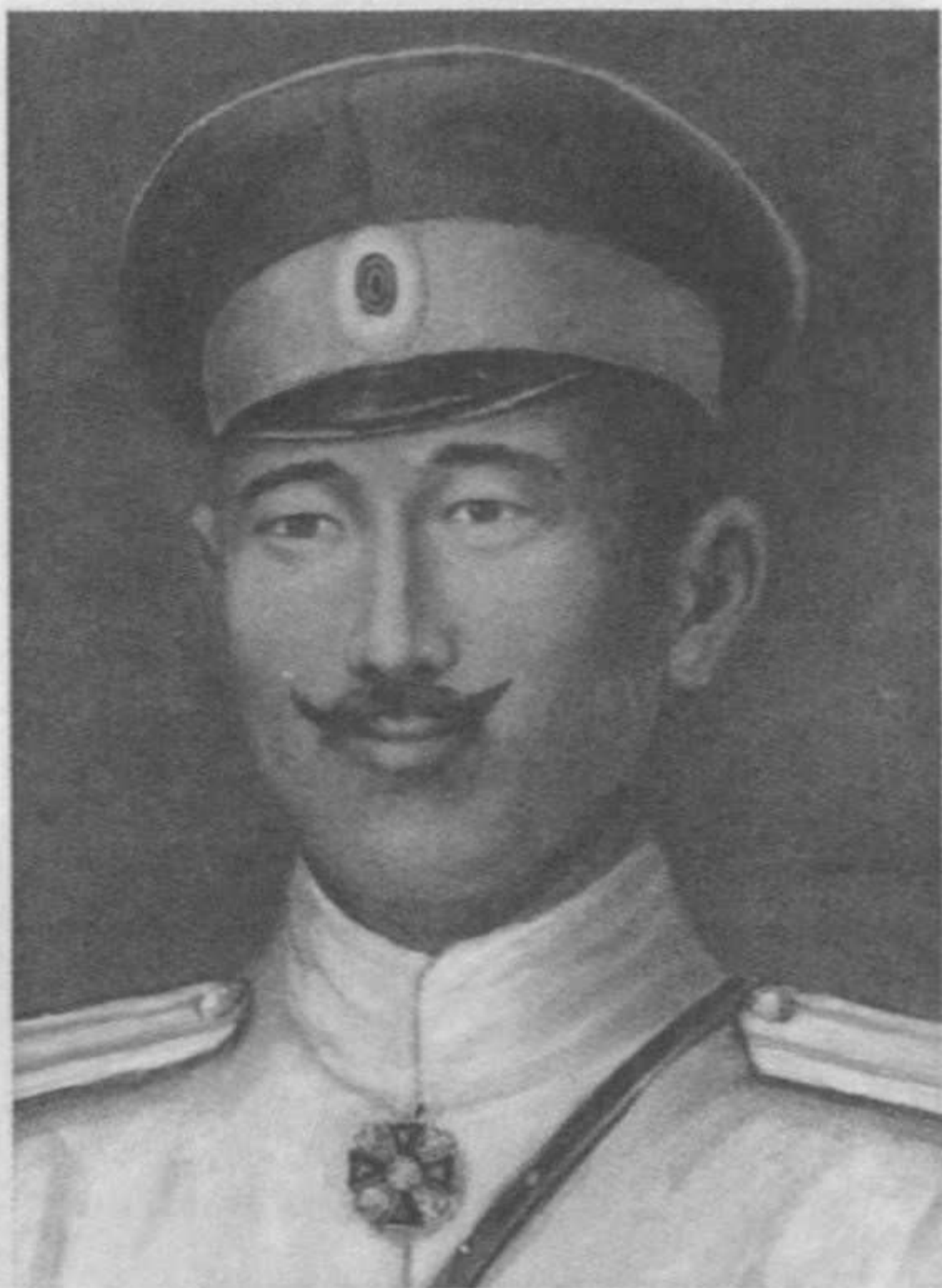
Полковник Гавриил Тепкин – командир 80-го Зюнгарского полка. Портрет, написанный по заказу П. Джевезинова